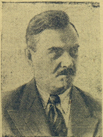
На снимке: избранный сессией Председатель Совета Народных Комиссаров РСФСР Николай Александрович Булгаков

Председатель Президиума Верховного Совета Карельской АССР