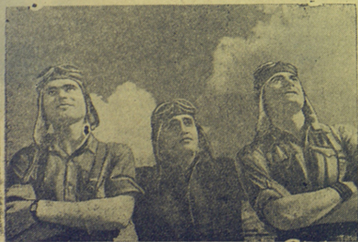
На снимке: Молодые летчики следят за полетом эскадрильи республиканских самолетов.