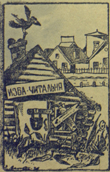
„Хата с крау“. Рисунок Г. Вальс.