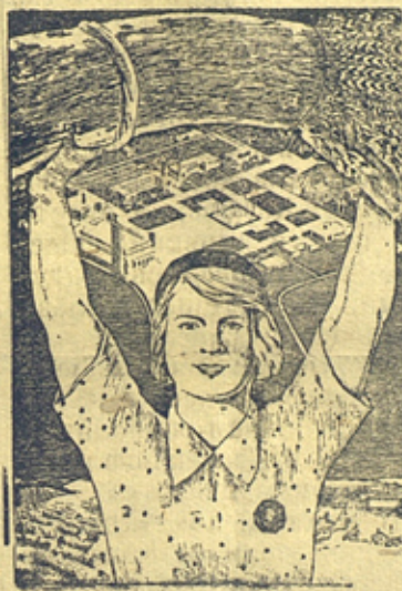
На снимке: Плакат работы художника А. Мартынова, выпущенный Изогизом в связи с подготовкой к открытию Всесоюзной сельскохозяйственной выставки Рис. о репродукции.

Лучшие достижения социалистического сельского хозяйства — на Всесоюзную сельскохозяйственную выставку