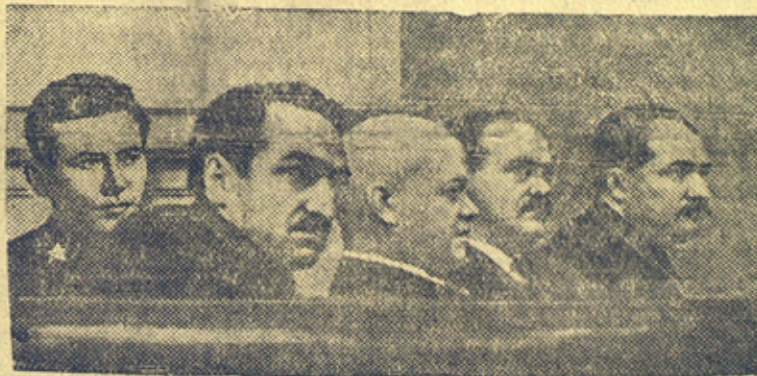
Товарищи ЕЖОВ, МИКОЯН, КОСИОР, МОЛОТОВ и КАГАНОВИЧ на Сессии Совета Национальностей