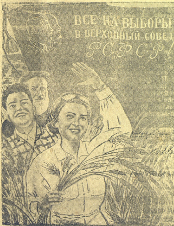
На снимке: плакат ИЗОГИЗа „Все на выборы в Верховный Совет РСФСР“.

Кто стремится к тому, чтобы наши колхозы и совхозы процветали и впрямь, давая нашей стране изобилие сельскохозяйственных продуктов, — тот будет голосовать за партию большевиков, тот будет голосовать за кандидатов блока коммунистов и беспартийных.