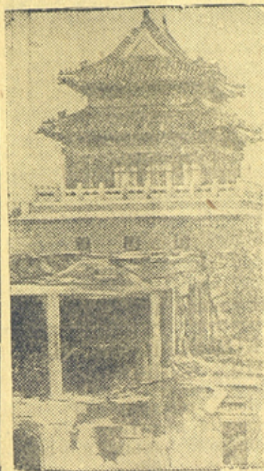
Вид китайского музея после бомбардировки

Японская авиация разрушает исторические памятники Китая.