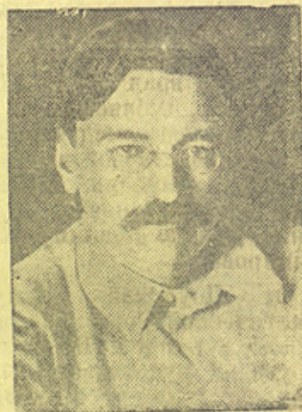
На снимке В. Р. Менжинский.