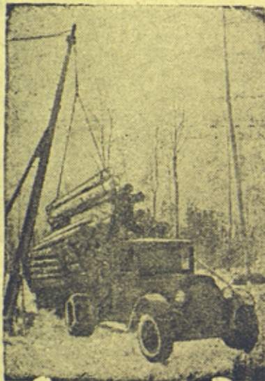
Загрузка древесины на автомашину лесоруб-краном.