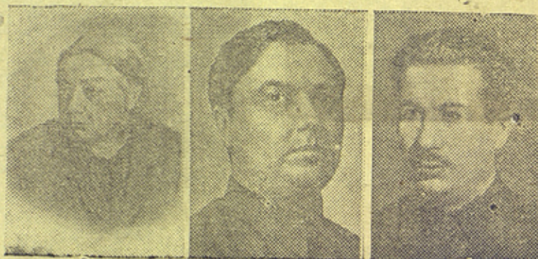
Н. К. Крупская Г. М. Маленков П. Г. Москатов