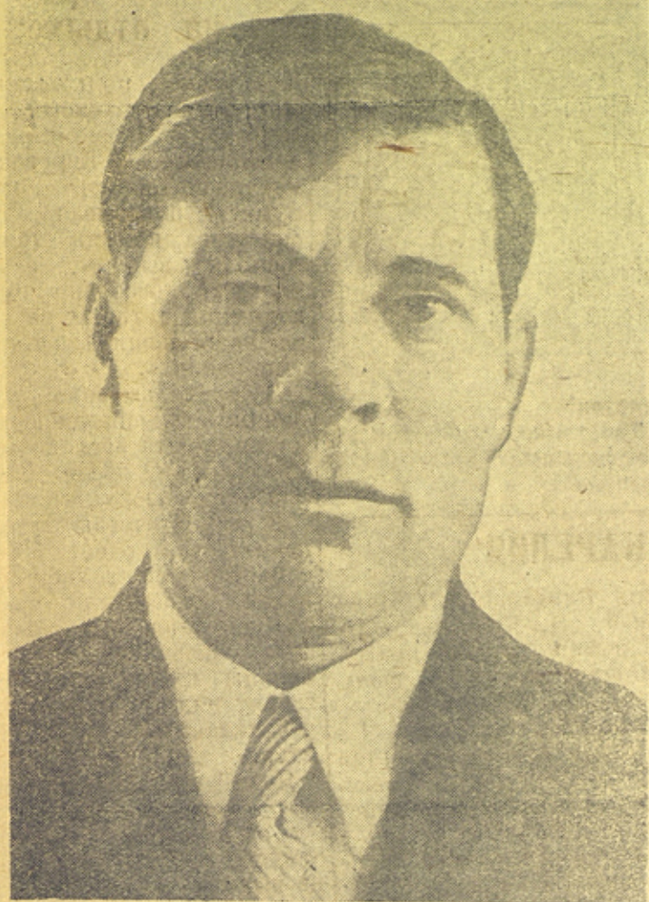
П. В. Соляков—депутат Верховного Совета СССР от Кемского избирательного округа