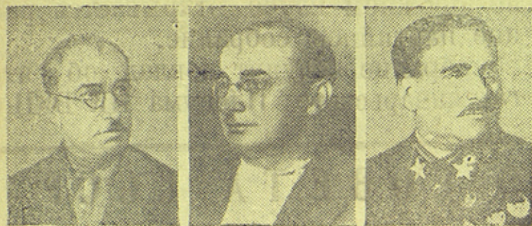
М. Д. Багиров Л. П. Берия В. К. Блюхер