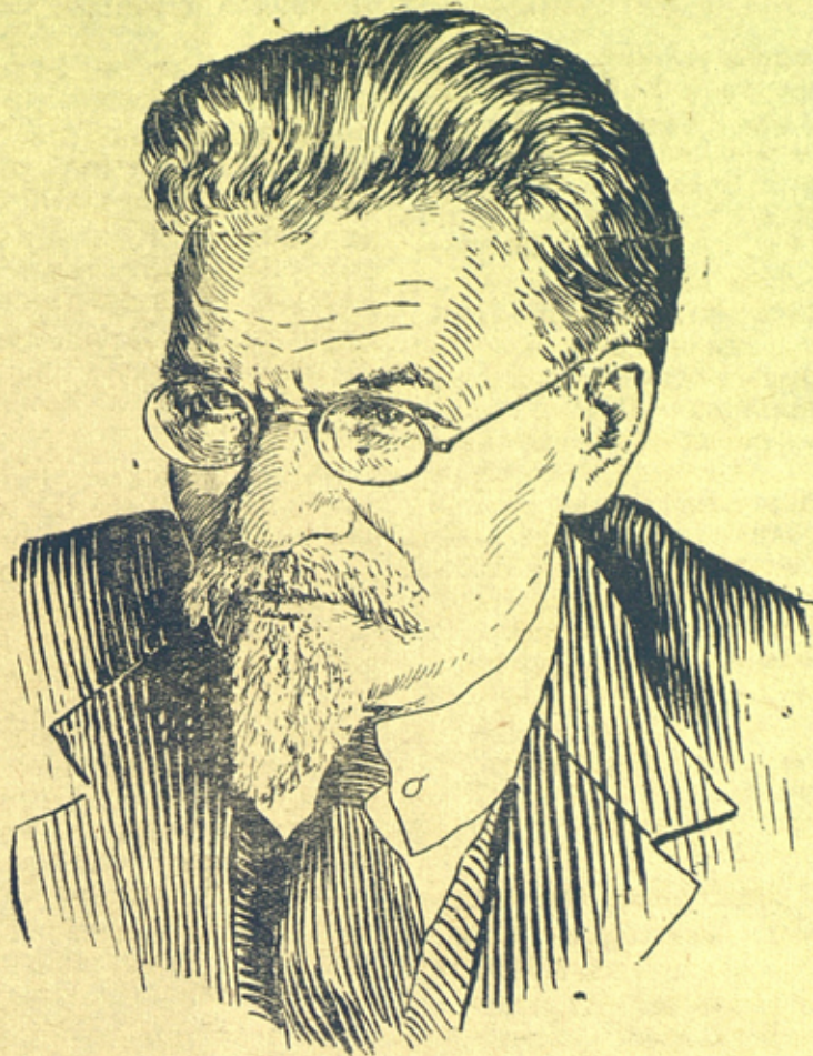
Михаил Иванович Калинин, Председатель Президиума Верховного Совета СССР

О СОВМЕСТНОМ ЗАСЕДАНИИ СОВЕТА СОЮЗА И СОВЕТА НАЦИОНАЛЬНОСТЕЙ 17 ЯНВАРЯ 1938 ГОДА