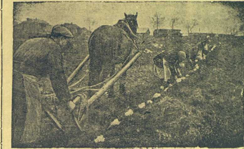
Посадка семенной капусты в колхозе им. Ильича (Кунцевский район, Московской области).

Руководители этих колхозов, председатели сельсоветов и колхозники должны все внимание обратить на то, чтобы весенний сев провести в самые сжатые сроки и на высоком агротехническом уровне, добиться высокого сталинского урожая.