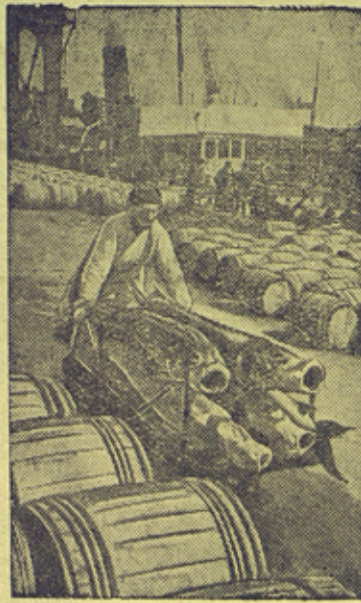
Приемка свежей рыбы.

Весенняя путина на Каспии. На Бакинском холодильнике Главхладпрома непрерывно поступает свежая рыба с рыбных промыслов и заводов „Азырбresta“ и рыболовецких колхозов.