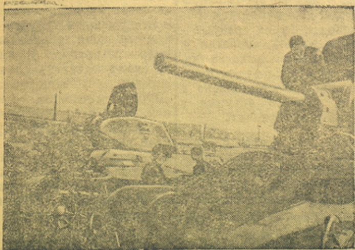
Последняя проверка танков на Н-ском танковом заводе перед отправкой на фронт.

Ознаменуем XXV годовщину Великой Октябрьской социалистической революции новыми победами над врагом. Все для фронта, все для победы!