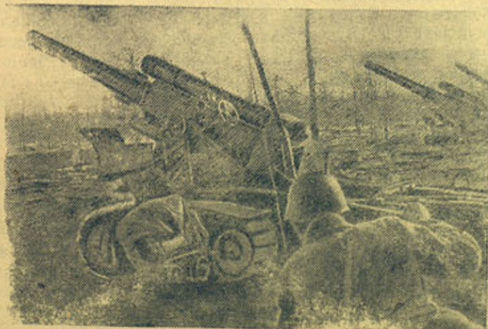
На снимке: Батарея советских дальнебойных орудий на огневой позиции.