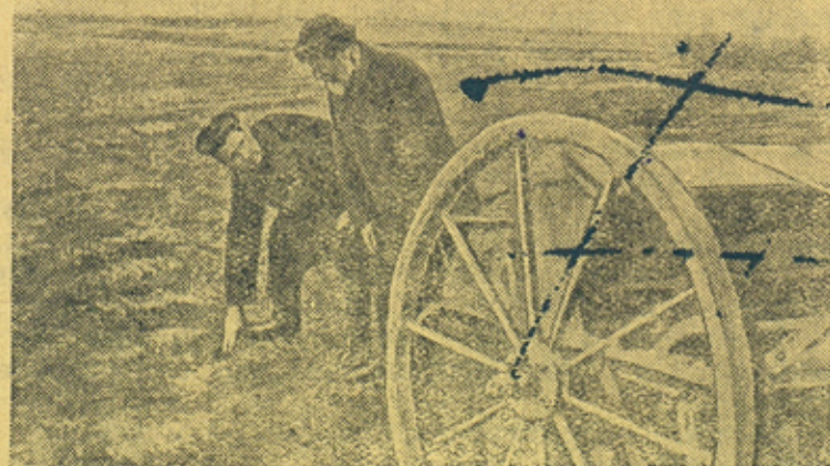
На снимке: Сев сверх плана в передовом колхозе „Власть Советов“ (Борский район).

Передовые колхозы Горьковской области закончили сев зерновых и засевают гектары сверх плана в фонд обороны и помощи колхозам оовожденных районов.