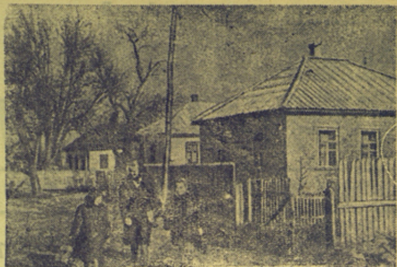
Быстрыми темпами восстанавливается одна из красивейших станций Кубани—станция Крымская, Краснодарского края, почти полностью сожженная гитлеровскими захватчиками. На снимке: один из уголков восстановленной станции Крымской.

В Варшавском военном суде начался процесс семнадцати членов террористической организации, действовавшей в районе города Пултуска. Обвиняемые занимались шпионажем и готовились к нападениям на демократических деятелей Польши. (ТАСС).