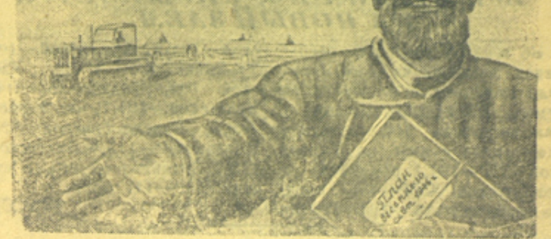
Плакат работы художника Ю. Алферова, выпущенный издательством „Искусство“.