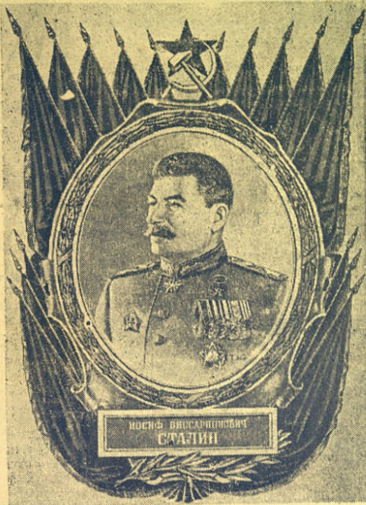
Всенародный кандидат в депутаты ВЕРХОВНОГО СОВЕТА С. С. С. Р.