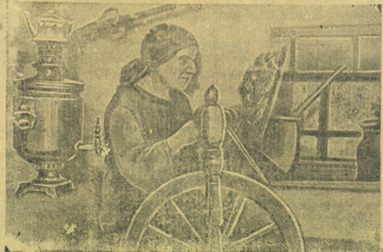
На снимке: старая колхозница, мать трех фронтовиков А. М. Дерникова прядет шерсть на чулки для посылки бойцам от имени колхоза. От себя лично она уже отправила 3 посылки в воинскую часть, где служат ее сыновья.

Колхозники сельхозартеля „Большевистский труд“ (Купинский район, Новосибирская область) послали в подарок бойцам Красной Армии много теплых вещей своей работы.