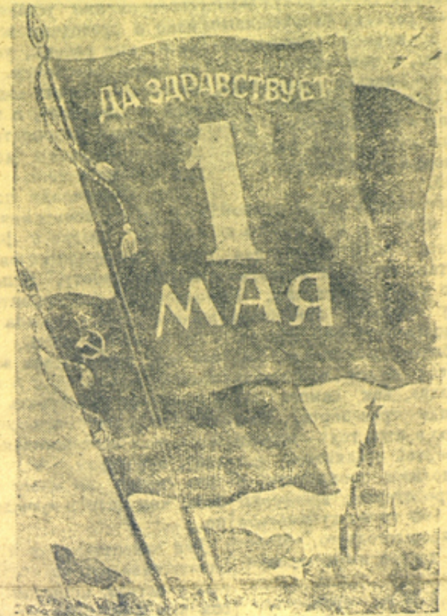
Плакат работы художника В. Ливановой, выпущенный издательством «Искусство».

Четыре жилых дома, на постройке которых они работают, скоро будут достроены и в них разместятся лучшие рабочие бумкомбината. А. ЦИКОВ.