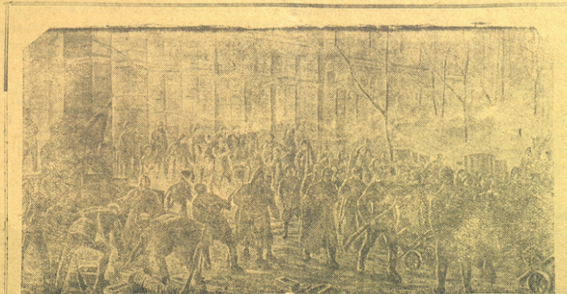
В дни Великой Октябрьской Социалистической революции здание бывшего Смольного института, где находились Центральный Комитет партии большевиков и Петроградский Совет рабочих и солдатских депутатов, стало боевым штабом революции. Восстанием руководили В. И. Ленин и возглавлявший Партийный центр по руководству восстанием И. В. Сталин. На снимке: „Штаб Октября“.

(Из призывов ЦК ВКП(б) к 30-й годовщине Великой Октябрьской социалистической революции.)