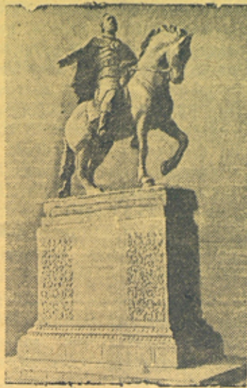
Проект памятника основателю Москвы Юрию Долгорукому. Работа скульптора Г. Мотовилова.