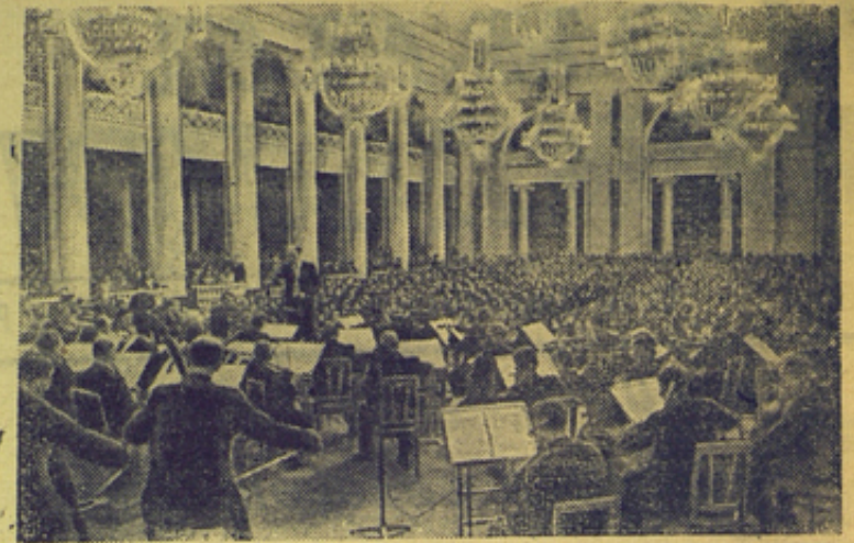
Героический Ленинград залечивает свои раны. С каждым днем восстанавливается его промышленность, ремонтируются здания. Культурная жизнь бьет ключом. Ленинградская орден Трудового Красного Знамени Государственная филармония проводит двадцать пятый юбилейный сезон.

На снимке: в Большом зале филармонии во время концерта.