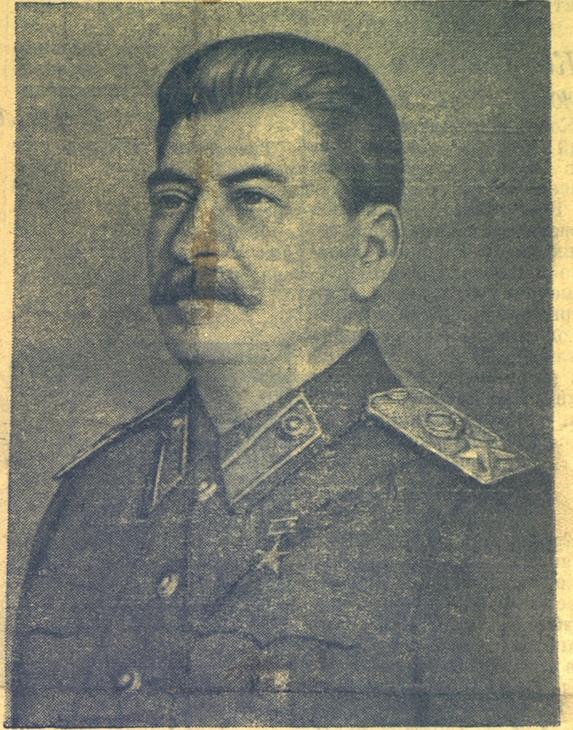
Н. В. СТАЛИН.