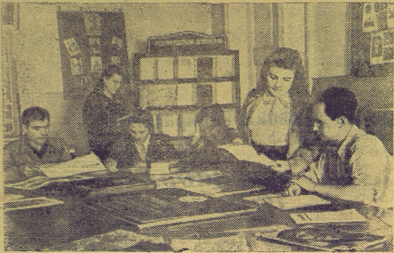
Львовская область. Секольский районный партийный комитет хорошо подготовился к началу партийной учебы. В помощь изучающим историю ВКП(б) подобрана литература и наглядные пособия. Кабинет имеет достаточное количество книг на украинском языке, в том числе Краткий курс истории ВКП(б), сочинения Ленина и Сталина.