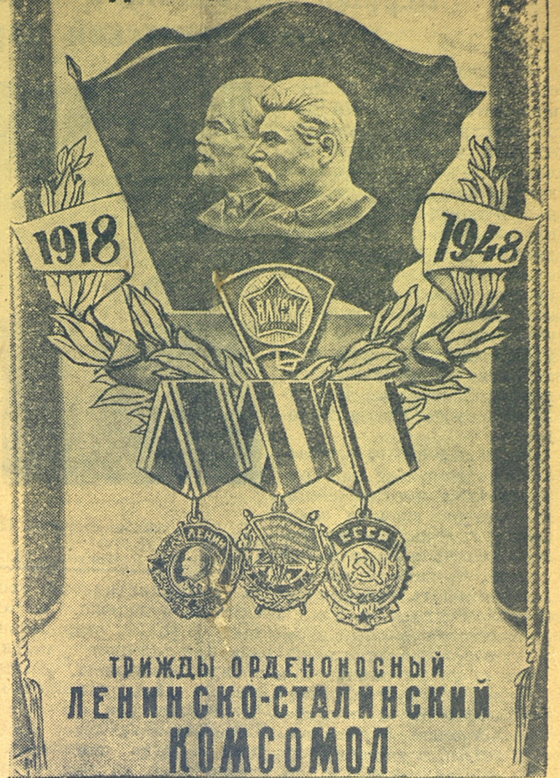
Плакат работы худ. И. Гапфа, выпущенный издательством „Искусство“.