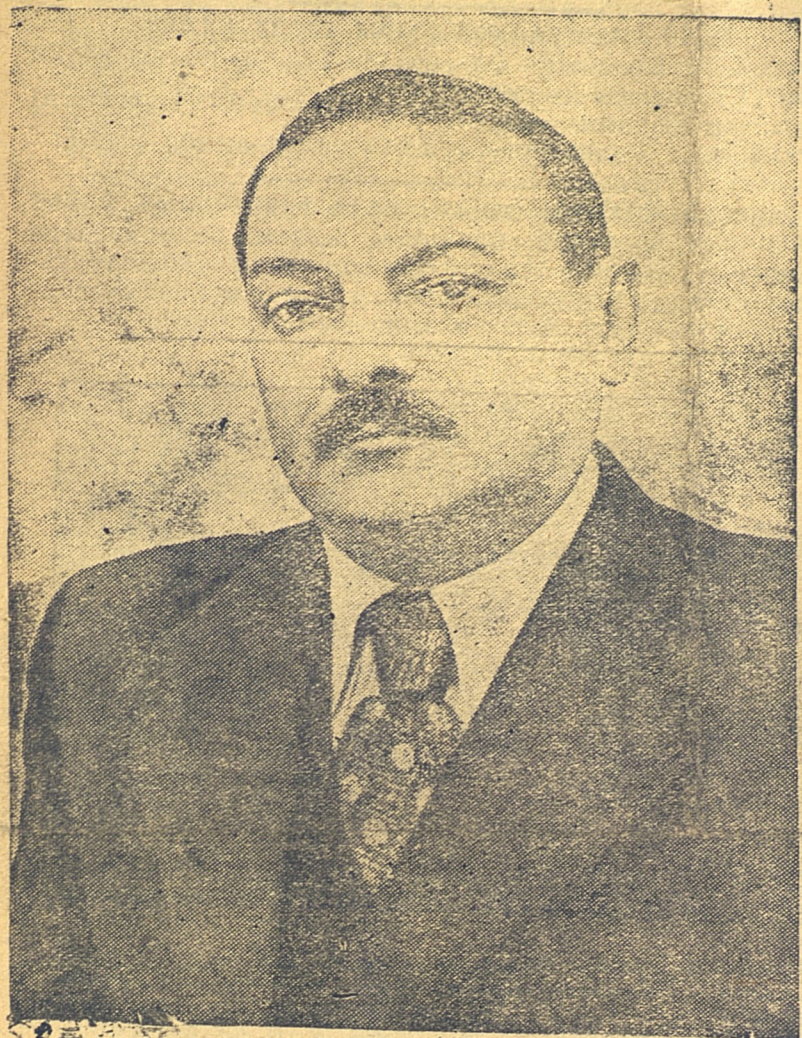
Андрей Александрович ЖДАНОВ