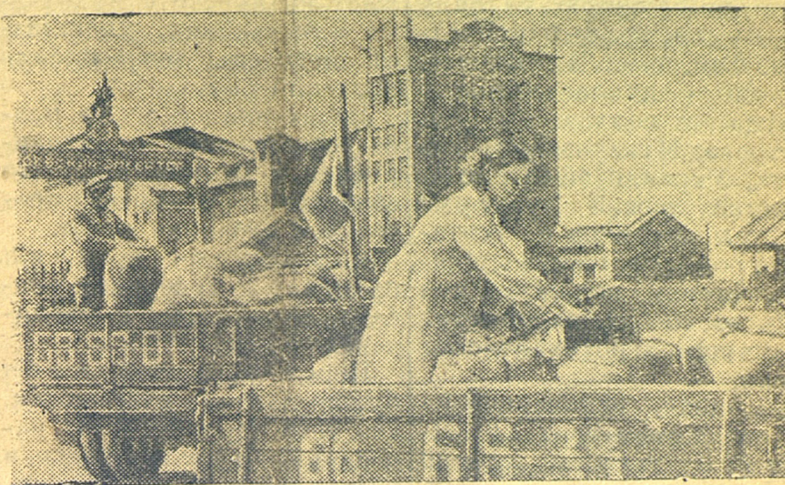
Башкирская АССР. На Раевском элеваторе в Ашбеевском районе. Автомашини колхоза „Красная Звезда“ привезли хлеб.