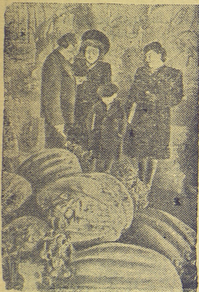
Рига. Здесь состоялась сельскохозяйственная и промышленная выставка, демонстрирующая достижения республики за 1947 год.

При обнаружении этого вредителя или его личинки нужно сразу же приступить к сбору и уничтожению их и одновременно, умертвив 1—2 в посуде с керосином, бензином, формалином или спиртом, немедленно доставить эту посуду в районный земельный отдел. Место обнаружения жука или личинки, поврежденного куста картофеля или другого растения из семейства пасленовых нужно отметить какой-нибудь вешкой.