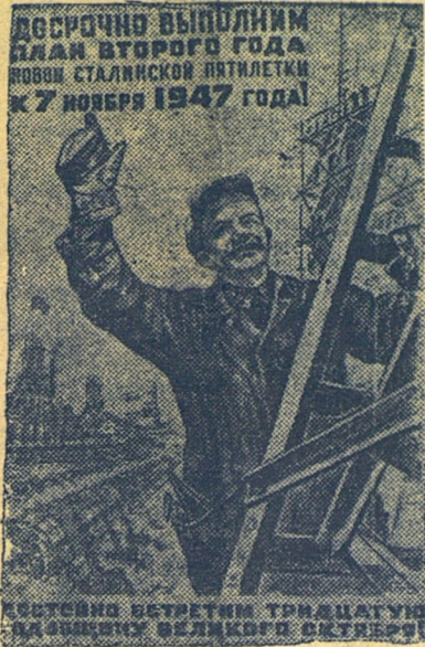
Плакаты работы художника П. Кривоногова, выпущенный издательством "Искусство".