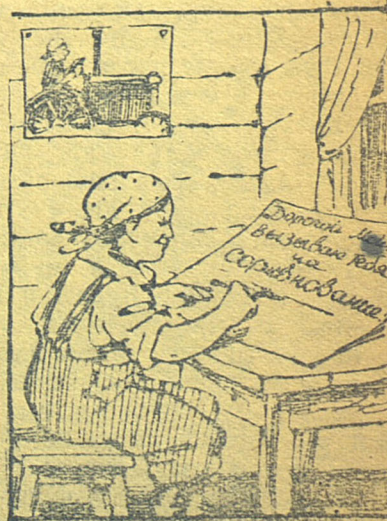
Посмотрю, какова его любовь к делу. Рис. Ю. Узбякова.