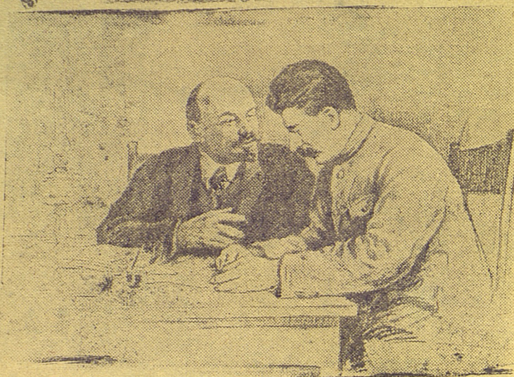
Беседа В. И. Ленина с И. В. Сталиным.

В статье, посвященной 4-летней годовщине Октябрьской революции, В. И. Ленин писал: „Мы вправе гордиться и мы гордимся тем, что на нашу долю выпало счастье начать по-