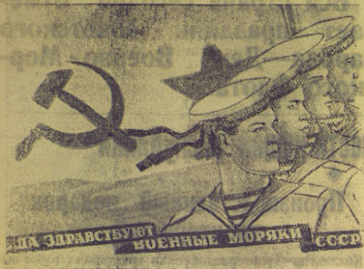
Плакат работы художника Кокорекина (Издательство „Искусство“)