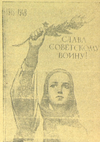
Плакат работы худ. В. Иванова, выпущенный издательством „Искусство“.

Орский нефтеперерабатывающий завод закончил прошлый год с убытком. Теперь нефтяники решили работать без государственной дотации и наметили мероприятия, которые позволят резко уменьшить производственные потери. (ТАСС.)