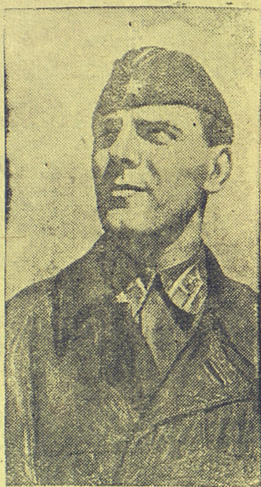
Герои отечественной войны.

Всегда жизнерадостный, чуткий и отзывчивый товарищ,—таким знают Еремина бойцы эвской части. В свободные от учебы ча-