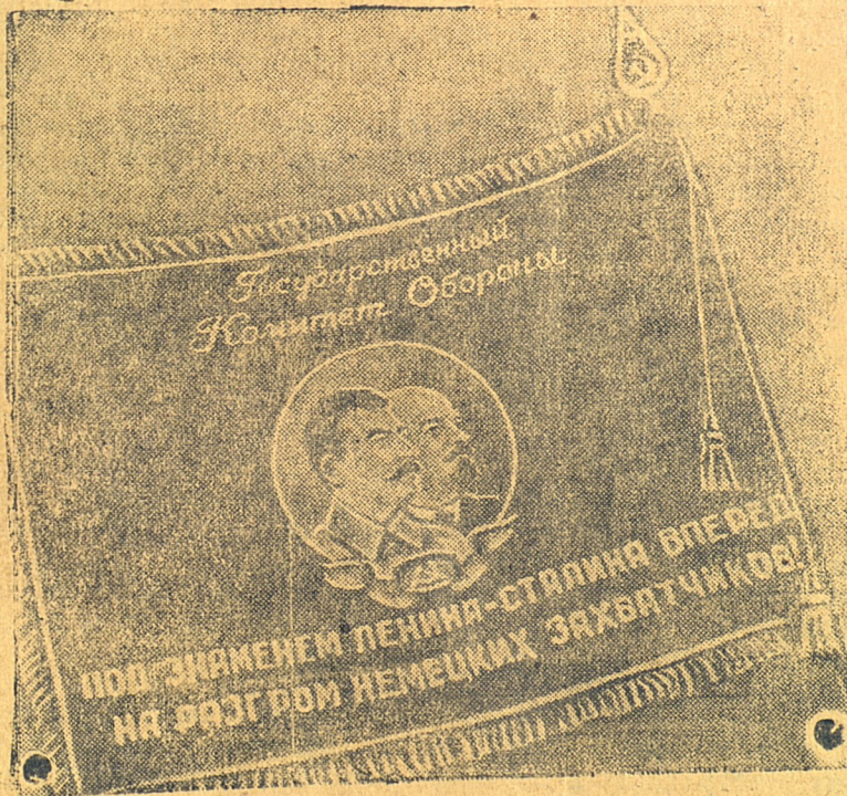
Лицевая сторона Красного Знамени для лучшего завода авиационной промышленности.